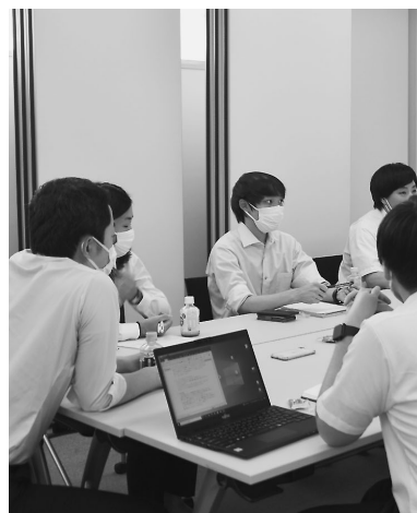
新たな構想が次々に生まれた座談会

安全ボスターにもケン・ブリッチくんいますよ。私ももっと業界に広めた方がいいかな。私もみかんに入るまで、知らなかったの。