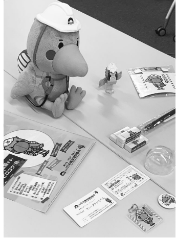
グッズもたくさん