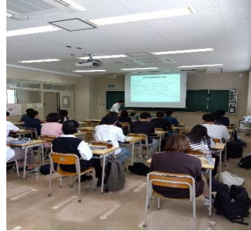
写真2: 講義状況(全景)